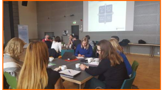
Το έργο KISA στην περιφέρεια της Ουψάλας

Το Folkuniversitetet στην Ουψάλα έχει ξεκινήσει συνεργασία με τις δημόσιες υπηρεσίες απασχόλησης στην περιοχή της Ουψάλα στο πλαίσιο του έργου KISA (Γρήγορη ενσωμάτωση, ταχύτερη εργασία) που χρηματοδοτείται από το Ευρωπαϊκό Κοινωνικό Ταμείο. Στόχος του έργου KISA είναι η ανάπτυξη τοπικών συμφωνιών για την ένταξη των νεοαφιχθέντων σε 8 δήμους στην περιοχή της Ουψάλα. Ο ρόλος του σχεδίου Igma-Femina σε αυτή τη συνεργασία είναι να εισαγάγει στις τοπικές συμφωνίες κριτήρια ισότητας των φύλων. Οι συμφωνίες θα υπογραφούν από τα τοπικά δίκτυα ενδιαφερομένων σε 8 δήμους και θα εφαρμοστούν τόσο ως στρατηγικά όσο και ως πρακτικά εγχειρίδια για την προώθηση της ένταξης των νεοαφιχθέντων στην αγορά εργασίας.