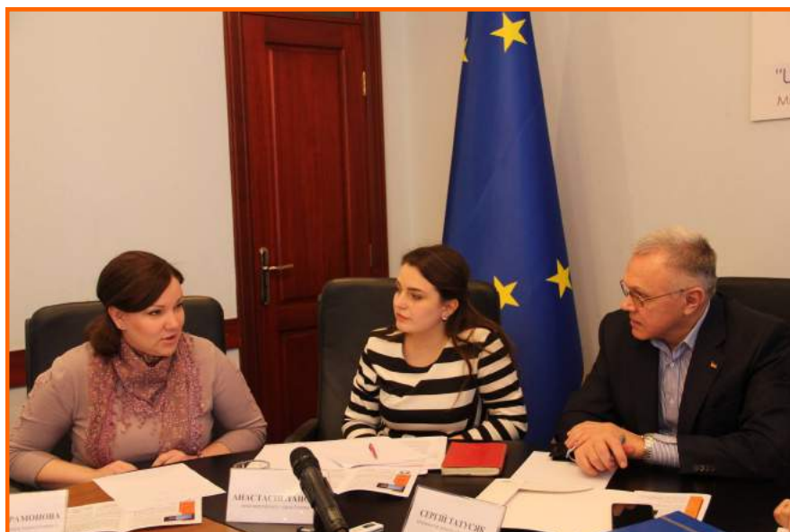
Igmа-Femina прес-конференція у м. Вінниця, Україна