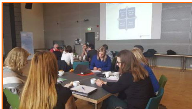
KISA проект у регіоні Уппсала

Фолькуніверситет почав співпрацювати із державними службами зайнятості в м. Уппсала в рамках проекту KISA (Швидша інтеграція – коротший шлях до працевлаштування), що фінансується Європейським соціальним фондом. Метою проекту KISA є розробка місцевих угод інтеграції новоприбулих осіб у 8 муніципалітетах м. Уппсала. Роль проекту «Igmata-Femina» у цій співпраці полягає в тому, щоб у місцеві угоди впровадити критерії гендерної рівності. Угоди підпишуть місцеві мережі зацікавлених сторін у 8 муніципалітетах та використовують їх в якості стратегічних та практичних вказівок для сприяння інтеграції новоприбулих осіб на ринок праці. Детальну інформацію можна знайти за посиланням: www.kisaprojektet.se