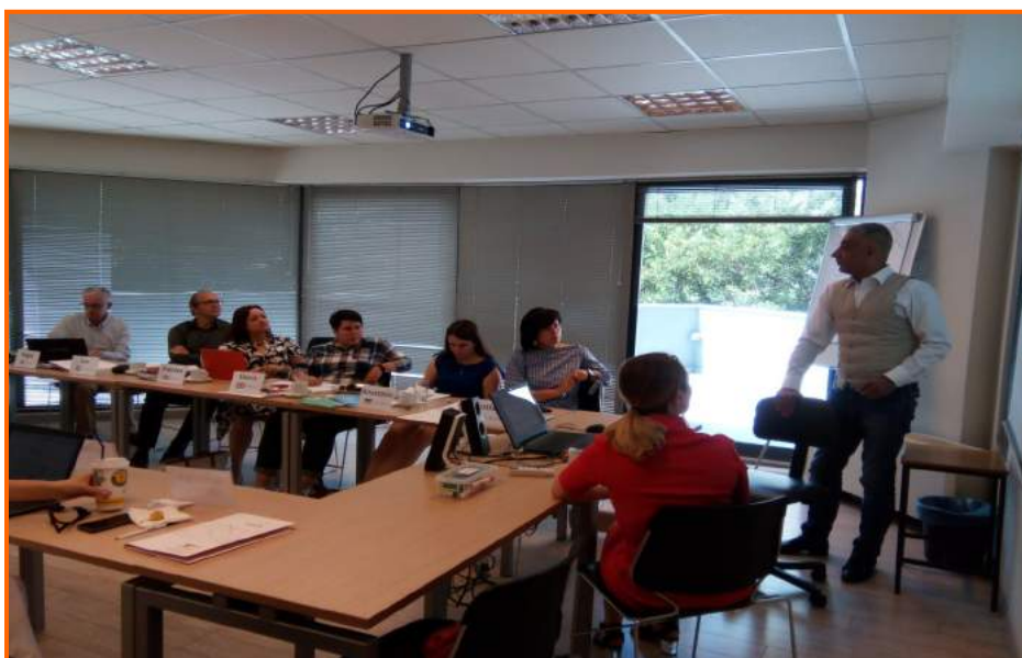
Друга транснаціональна зустріч у м. Ларіса (Греція)

Другий етап проекту – методологія Iqma-Femina для співпраці мереж місцевих зацікавлених сторін, котрі працюють з жінками-мігрантами та переселенцями – реалізовано під час Другої транснаціональної зустрічі. Разом з тим, партнери обговорили та узгодили подальші ключові кроки, необхідні для успішної реалізації та досягнення результатів по усім інтелектуальним результатам, а також для процесів управління проектом й розповсюдження інформації. На кінець, прийнято рішення, що наступна зустріч в рамках проекту відбудеться 25-26 січня 2018 р. в Англії, де партнери зосередяться на розробці методології Iqma-Femina.