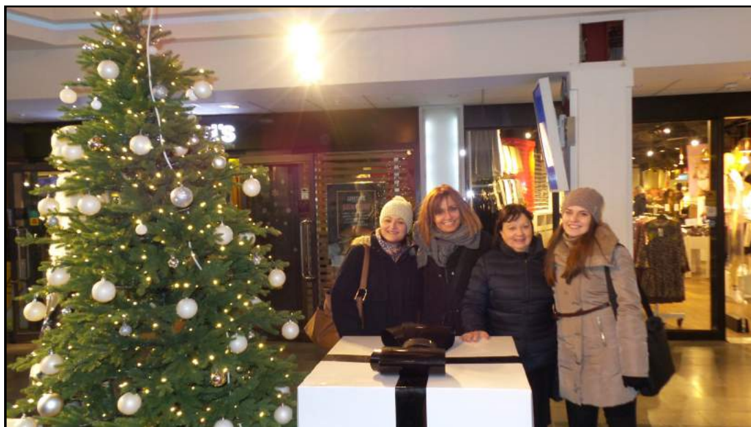
Εταίροι του έργου από Ελλάδα, Μ. Βρετανία & Ουκρανία στην Ουψάλα, Σουηδία

Centrum för genusvetenskap, Uppsala University