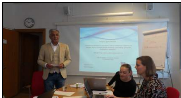
Ο συντονιστής του έργου Folkuniversitetet (Σουηδία) ανοίγει την εναρκτήρια συνάντηση, Δεκέμβριος 2016

Το συγκεκριμένο πρόγραμμα αποτελεί συνέχεια προηγούμενων επιτυχημένων έργων IGMA, χρησιμοποιώντας τη μεθοδολογία των ολοκληρωμένων υπηρεσιών και τη συνεργασία περιφερειακών δικτύων.