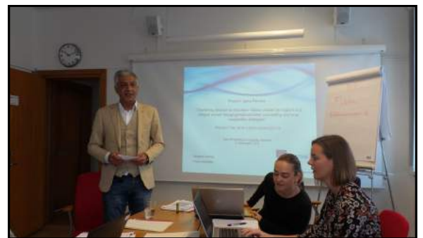
Основний партнер, Folkuniversitetet (Швеція), відкриває стартову зустріч (грудень 2016)

Проект є продовженням попередніх успішних проектів Igma з використанням методології інтегрованих послуг та співпраці мережі зацікавлених сторін.